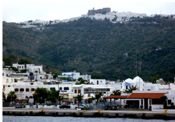
(Twee foto's van Patmos)