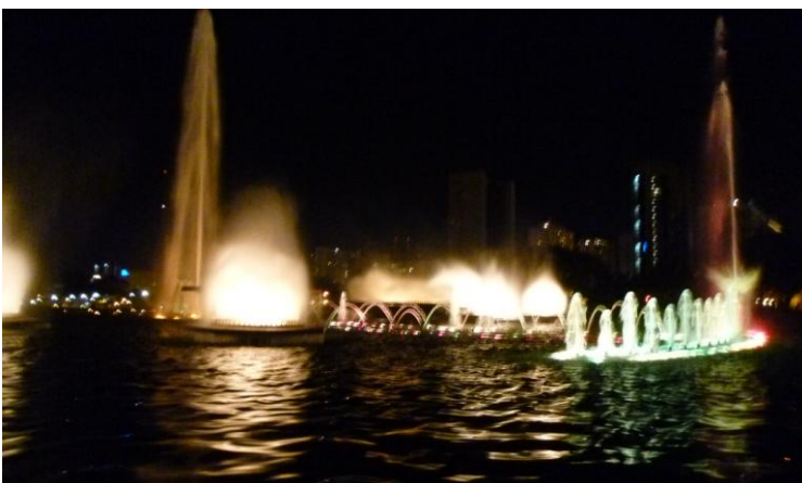
De fonteinen bij avond

Vanaf de televisietoren heeft men een prachtig uitzicht over het centrum (na de bovenste cirkel beginnen links en rechts de vleugels, de woonwijken)