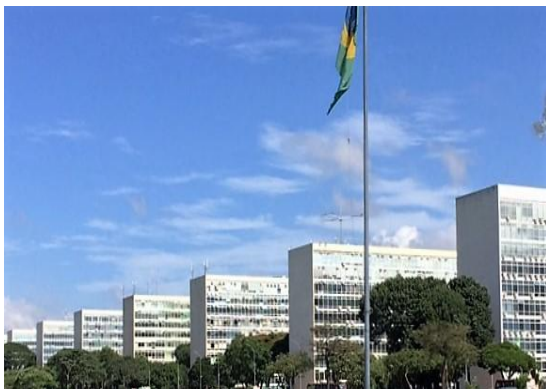
alle ministeries op een rij

de 3 poderes) met daaraan gelegen het werkpaleis van de president - Palacio Planalto - het Congres ( de foto rechts ) en het Hoger Gerechtshof. Brasilia is een stad zonder historische banden. Kenmerken van de koloniale overheerser zijn er niet .