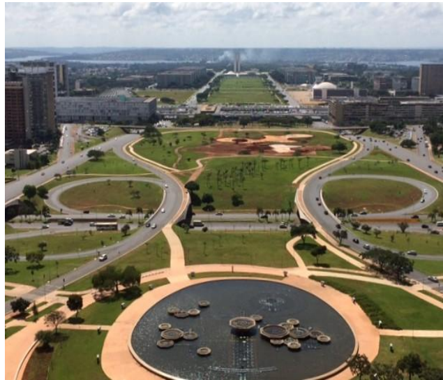
Het centrum van de stad.

Wat opvalt zijn de ongelijkvloerse kruisingen waarmee de ontwerpers hun tijd ver vooruit waren. Het verkeer is in Brasilia geordend, in tegenstelling tot andere grote steden in Brazilië, waar de chaos de overhand heeft.