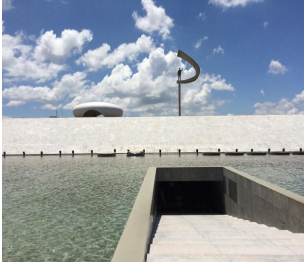
memorial van Juscelino Kubitschek