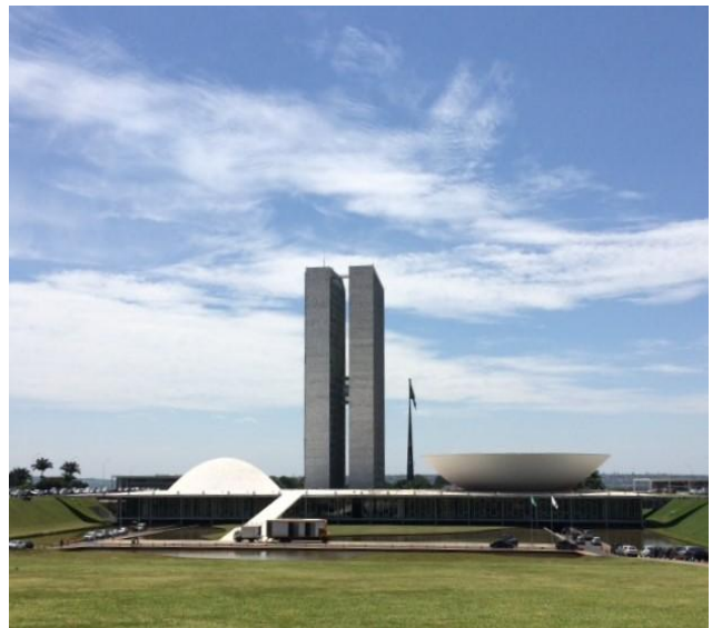
het centrum van de politieke macht links de Senaat en rechts de Camera (Tweede Kamer)

Het regeringscentrum wordt gevormd door het plein van de 3 machten (Praca